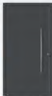
Hörmann Farbton CH 703 Anthrazit, strukturiert