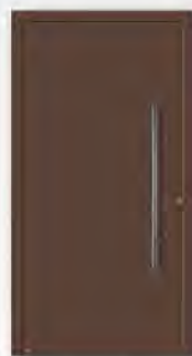
Hörmann Farbton CH 607 Marone- farben, strukturiert