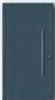
RAL 7015 Schiefergrau, matt