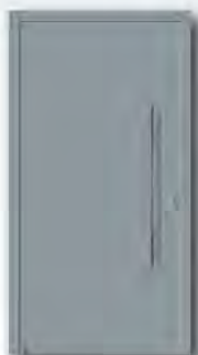
RAL 7040 Fenstergrau, matt