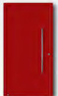
RAL 3003 Rubinrot, matt