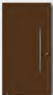
RAL 8028 Terrabraun, matt

außen VSG klar, innen Parsol grau, sandgestrahlt mit 7 klaren Querstreifen