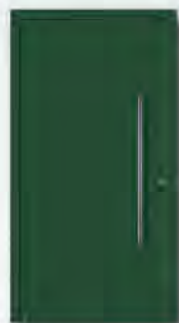
RAL 6009 Tannengrün, matt