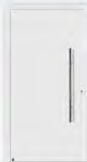
RAL 9016 Verkehrsweiß, hochglänzend