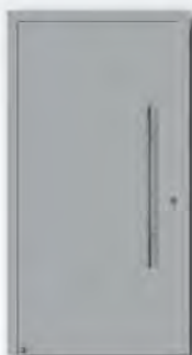
RAL 9006 Weißaluminium, seidenglänzend