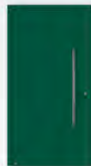
RAL 6005 Moosgrün, matt