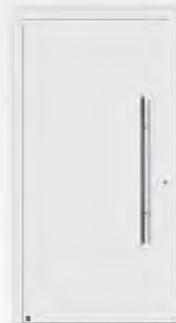
RAL 9016 M Verkehrsweiß, matt