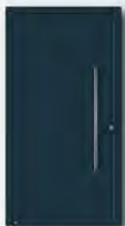
RAL 7016 Anthrazitgrau, matt